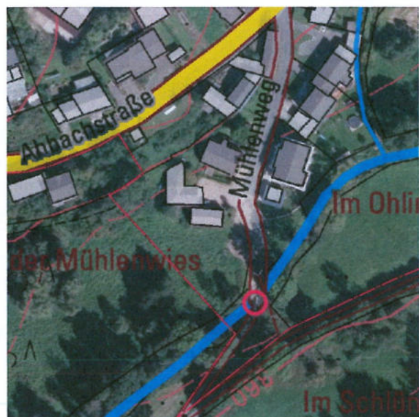
gepl. Fußgängerbrücke „Abbach“ am Gemeindehaus Üxheim-Ahütte