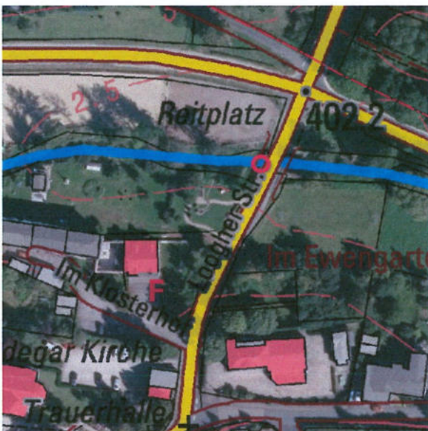
Brücke „Niedereher Bach“ am Feuerwehrhaus Niederehe

Aufgrund der notwendigen Voraussetzungen wären Messpegel an folgenden Standorte realisierbar: